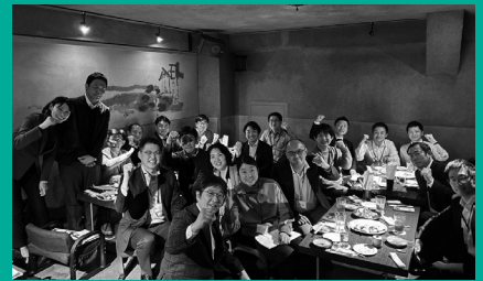
BBT大学大学院 TA 懇親会、 「社会変革型リーダー特論」受講者懇親会を開催しました!