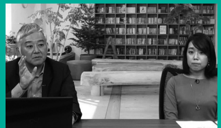
Business Breakthrough ch 「自律型人材として活躍するために必要な5つのこと」